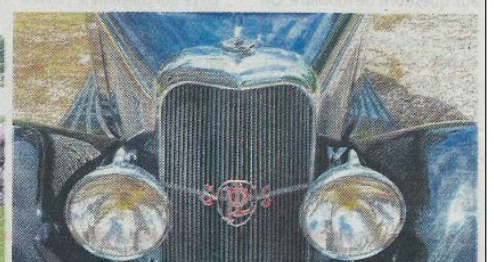
(De g. à d.) : La Panhard & Levassor Type P2D (1890). Au salon 1930, la nouvelle Panhard & Levassor 6DS X66 20CV impressionne. Sur la calandre le sigle « SPLS » qui signifie Panhard & Levassor Sans Soupapes ! En effet la marque se singularise en produisant des moteurs sans soupapes qui émettaient moins de vibrations.