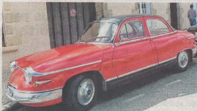
Des voitures qui éblouissent d'admiration !

Deux expositions ouvertes au public, dans la salle polyvalente et au boulodrome couvert, nécessiteront d'avoir le passe sanitaire. Elles retracent l'histoire civile, militaire et sportive de la firme Panhard. Elles sont en accès libre et gratuit. Un carré